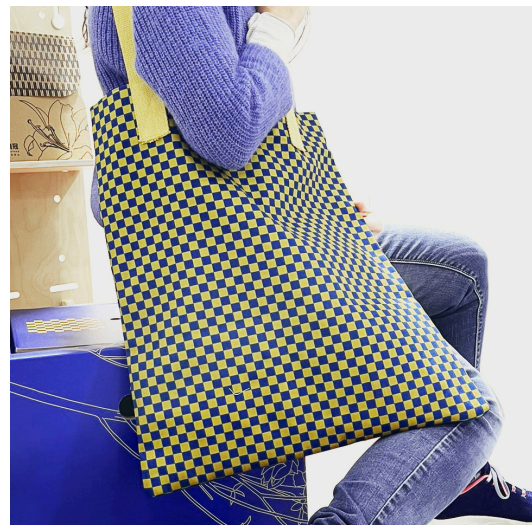
Dall'alto in basso, sinistra verso destra: Quaderno Kiku (crisantemo) pocket, Quaderno Himawari (girasole), Portadocumenti Tsutsuji (azalea), Pochette Himawari, Tote bag maxi Kiku